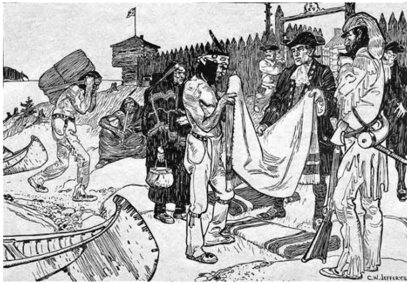
Le commerce des fourrures avec les Amérindiens en Nouvelle-France

Les Amérindiens connaissent la forêt et sont d'excellents chasseurs : ils deviennent donc des alliés indispensables pour les Français dans le commerce des fourrures . Contrairement aux Espagnols, les Français ne font pas des Amérindiens leurs esclaves. Ils les rétribuent pour leur travail en leur donnant divers produits manufacturés venus d'Europe. Toutefois, les échanges sont inégaux, sinon abusifs : vers 1625, on rapporte que les commerçants faisaient des profits de 2000% avec la traite des fourrures!